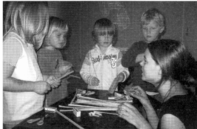
In Sri Lanka haben die Menschen auf dem Land oft nur ein Zimmer für die ganze Familie. Die Landhäuser werden in Miniaturformat nachgebaut.

Kontakt: Stefanie Alles, Presse- und Öffentlichkeitsreferentin, Stefanie.AUes@menschen-fairbinden.de Tel.: 0241 / 37378, weitere Informationen unter www.menschen-fairbinden.de